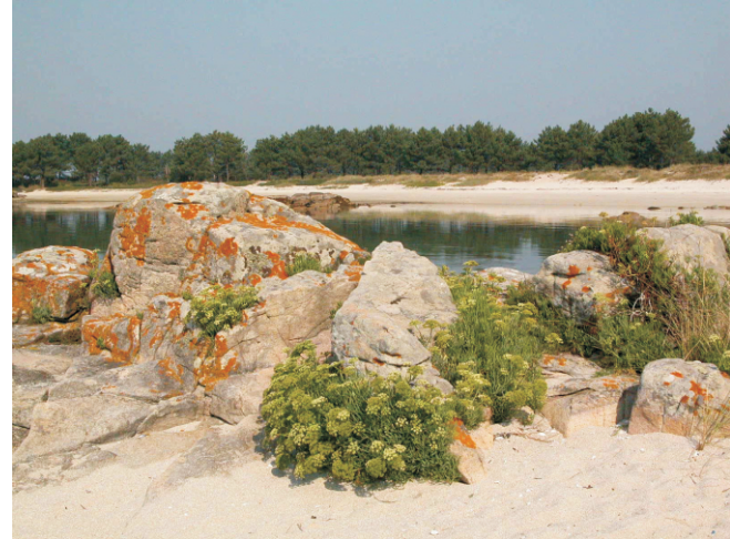
Vista dunha das praias do Carreirón.

Despois de cruzar a ponte collemos un desvío á esquerda na segunda rotonda e seguimos os indicadores ata o aparcamento. A ruta segue a liña de costa e está indicada.