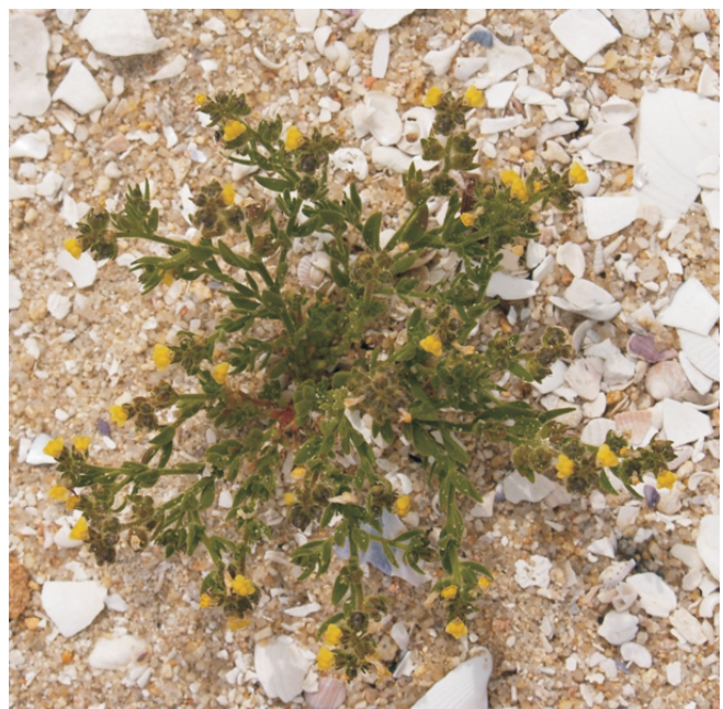
Linaria arenaria , unha planta dos areais que só se atopa no oeste de Francia e en Galicia, onde cada vez é máis rara. Un dos poucos lugares onde vive é nas praias do Carreirón.