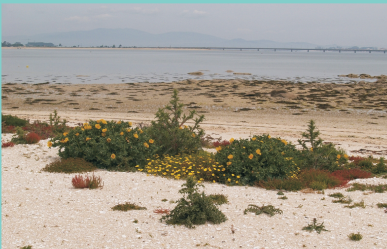
Praia de Xestelas